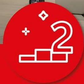
Chalki Aqua Team Γυμνάσιο – Λ.Τ. Χάλκης